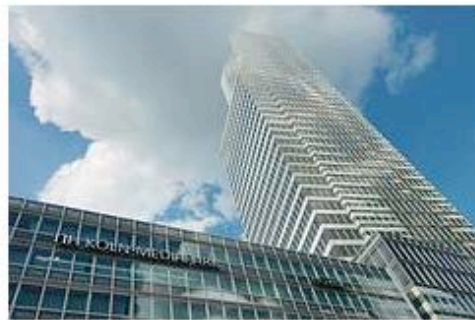
Das NH-Hotel und der KölnTurm im Mediapark.

Preis: Fläche: 27.000 qm + 220 Zimmer Laufzeit: