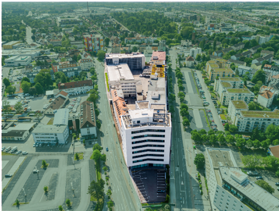
Ansicht Hanau Business Triangle