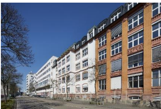
Ansicht Willy-Brandt-Straße