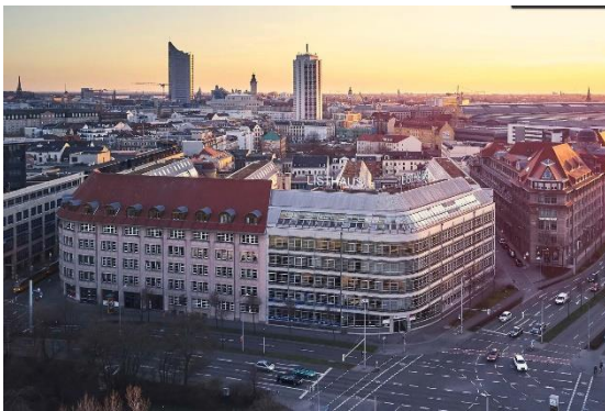
Listhaus Leipzig Art-Invest Real Estate