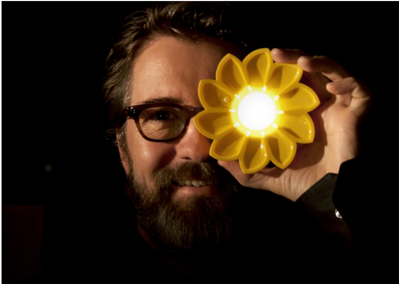
Künstler Olafur Eliasson mit der Solarleuchte Little Sun