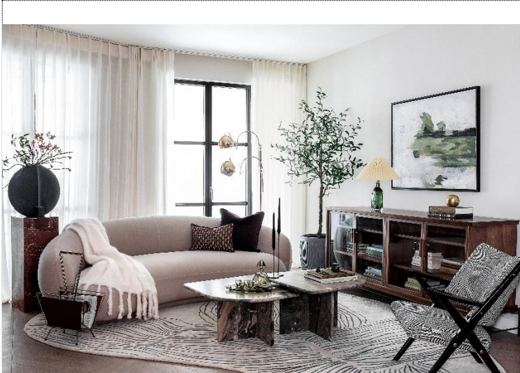
Beispielwohnung im Objekt 101 on Cleveland, London