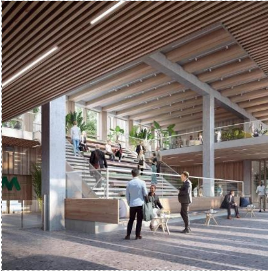
Eingangsbereich des M40