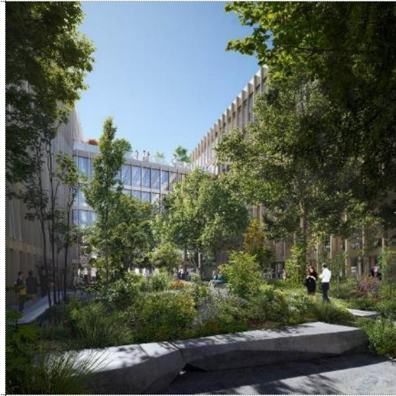
Begrünter Innenhof des M40

Pressekontakt: Strategiekollegen Bahnhofstraße 16 / Büßleber Gasse 99084 Erfurt Mobil: +49 170 228 32 99 Mail: andy@strategiekollegen.de