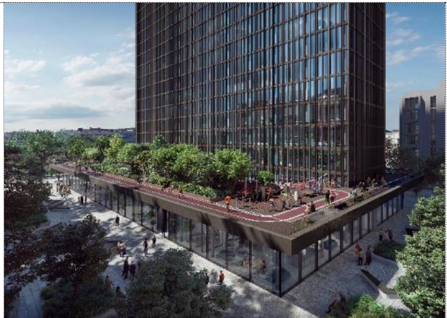
Outdoor-Parcours für sportliche Aktivitäten