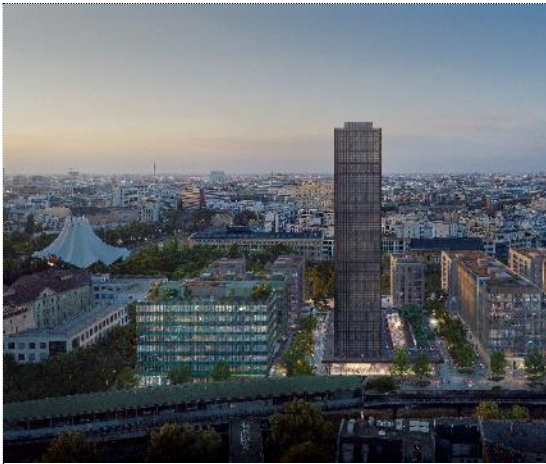
Visualisierung „Die Macherei Berlin-Kreuzberg“