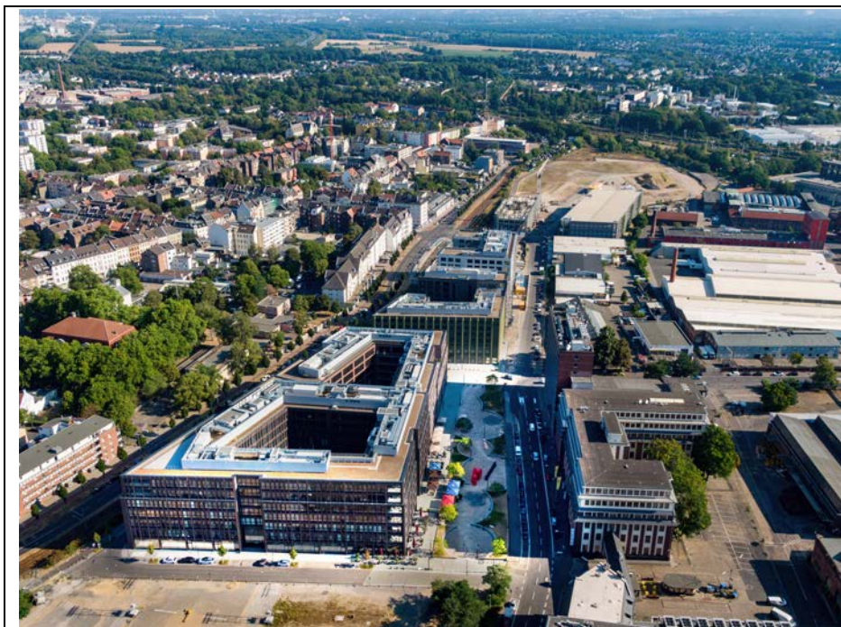
Das Gesamtareal von I/D Cologne, Luftaufnahme (Stand August 2022)