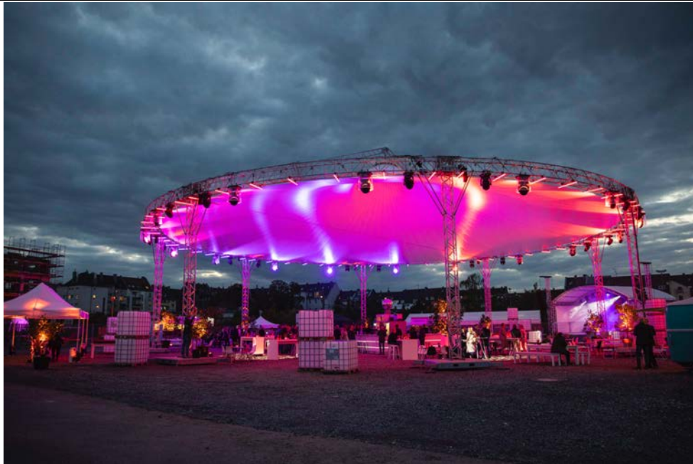
Gefeiert wurden die I/D Cologne Highlights: Tolle Stimmung unter dem Magic Sky Schirm.