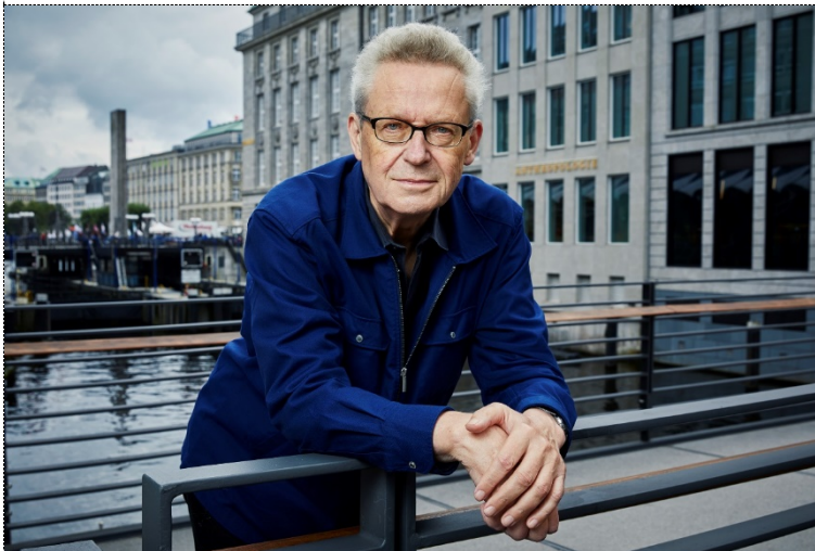
Lichtkünstler Michael Batz verbindet in diesem Jahr den Alten Wall mit dem Blue Port durch Illumination.