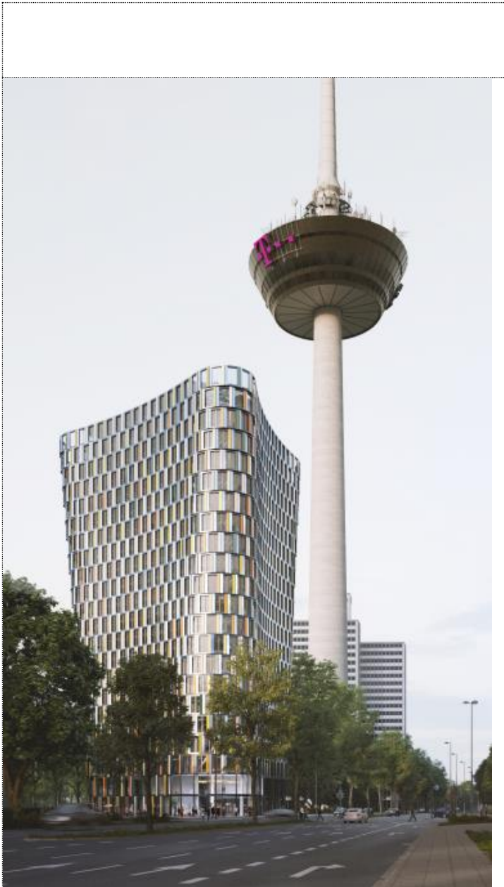
1. Preisträger Architekten Sauerbruch Hutton – Blickrichtung Kreuzung Subbelrather Straße / Innere Kanalstraße