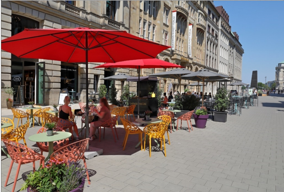
Der Flanier-Boulevard Alter Wall Hamburg