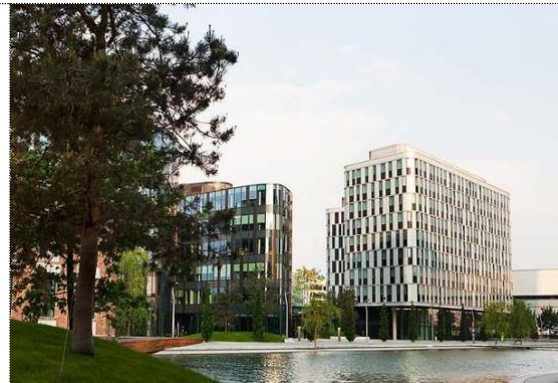
Außen Ansicht