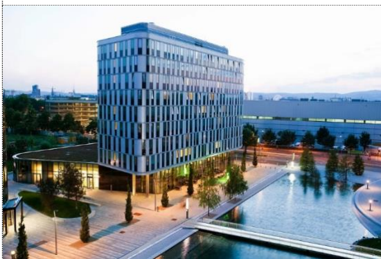
Außen Ansicht