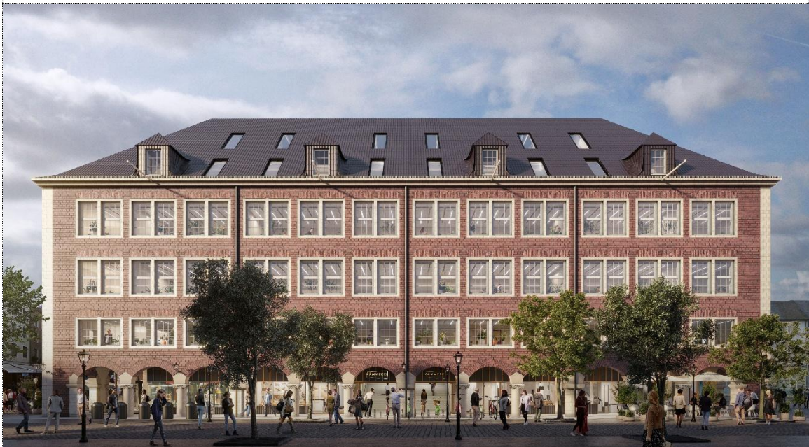
Die Kämmerei Düsseldorf