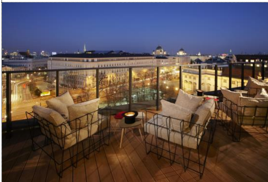
Rooftopbar „Der Dachboden“