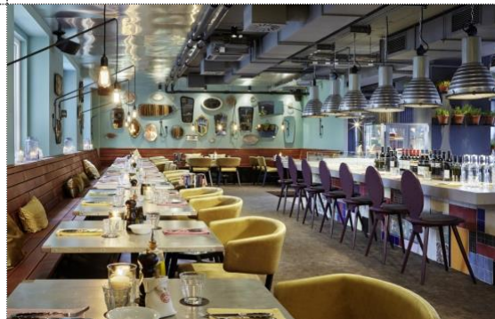
Restaurant „RIBELLI“