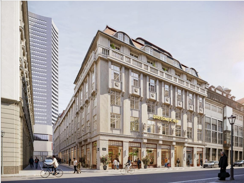
Dresdner Hof, Leipzig