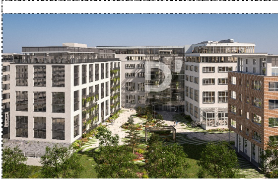
D'Carree im Düsseldorfer Stadtteil Derendorf