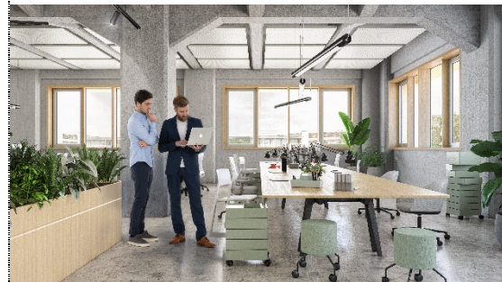
Open Space im D'Carree